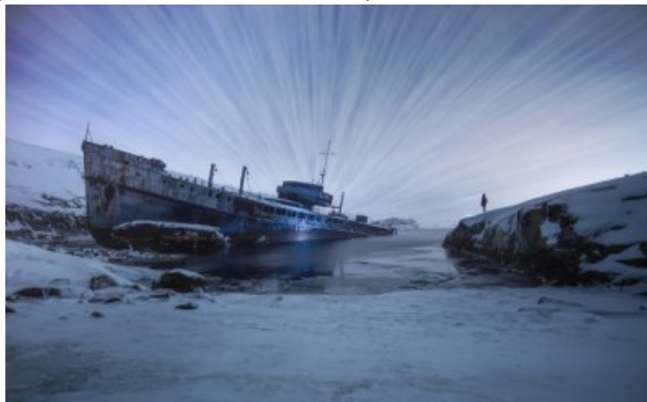
Navire fantôme abandonné

expériences locales mais que pèsent-elles dans la mondialisation/ ? Bref, il s'agit d'en finir avec la fuite en avant capitaliste, surnommée trop souvent abusivement progrès/ ; un progrès qui ne répond pas forcément à de réels besoins et si mal partagé, ignorant le plus souvent les équilibres de la biosphère et ouvrant l'ère de l'anthropocène [10], que l'on requalifiera capitalocène afin d'en éclairer les responsabilités.